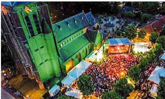
Evenement bij de kerk

Op 7 november heeft de gemeenteraad de begroting voor 2020 aangenomen. Er is budget beschikbaar gesteld voor de herinrichting van het St. Wilbertsplein en een onderzoek naar en het oprichten van een Multifunctionele Accommodatie (MFA).