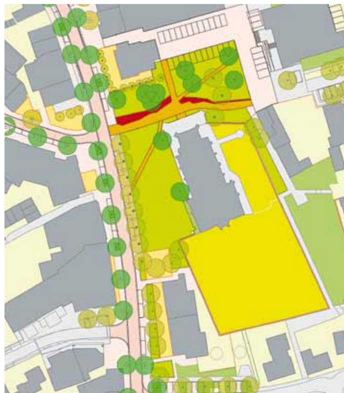
Ontwerp van het St. Wilbertsplein, met in het oranje de kerkepaden en in het rood de peelrandbreuk

Een ander historisch waardevol element dat terug komt is de peelrandbreuk die vanuit Deurne in noordwestelijke richting tussen Bakel en Milheeze door naar Gemert loopt en verder richting Uden. Het grondwater dat opwelt en borrelt op de plek van de peelrandbreuk is een inspiratiebron voor de inrichting van het St. Wilbertsplein.