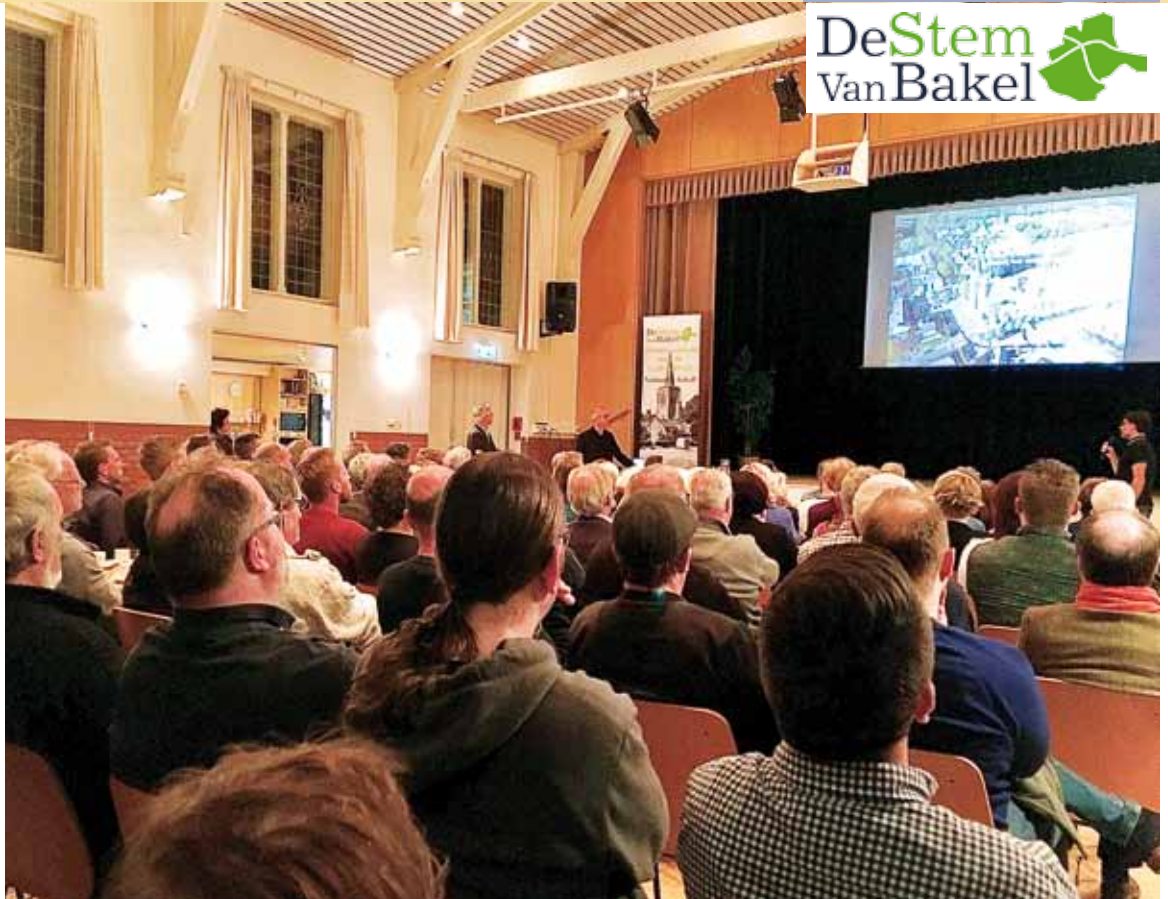
Bijeenkomst 4 december

Het centrum van Bakel functioneert als winkel-/voorzieningscentrum voor Bakel, Milheeze, Deurne en Helmond. De leefbaarheid van een dorp als Bakel staat onder druk van de maatschappelijke economische ontwikkelingen in de Nederlandse samenleving. Als resultaat hiervan daalt de aantrekkelijkheid van het centrum en komen voorzieningen verder onder druk te staan. Dit vraagt om sociale veranderingen in het centrum. Samen met inwoners, ondernemers en maatschappelijke partners onderzoeken we welke mogelijkheden er zijn om het centrum duurzaam te verbeteren, de teruggang te stoppen en daar waar mogelijk te keren. Een gezamenlijke aanpak is hierbij van belang, waardoor de betrokkenheid bij het dorp en de investeringskansen en –bereidheid van alle partijen weer toeneemt. De Stem van Bakel heeft hiertoe het initiatief genomen. In 2016 heeft zij een dorpsvisie met een actieplan opgesteld. De herontwikkeling van het centrum is als hoogste prioriteit benoemd. De gemeente Gemert-Bakel faciliteert dit programma.