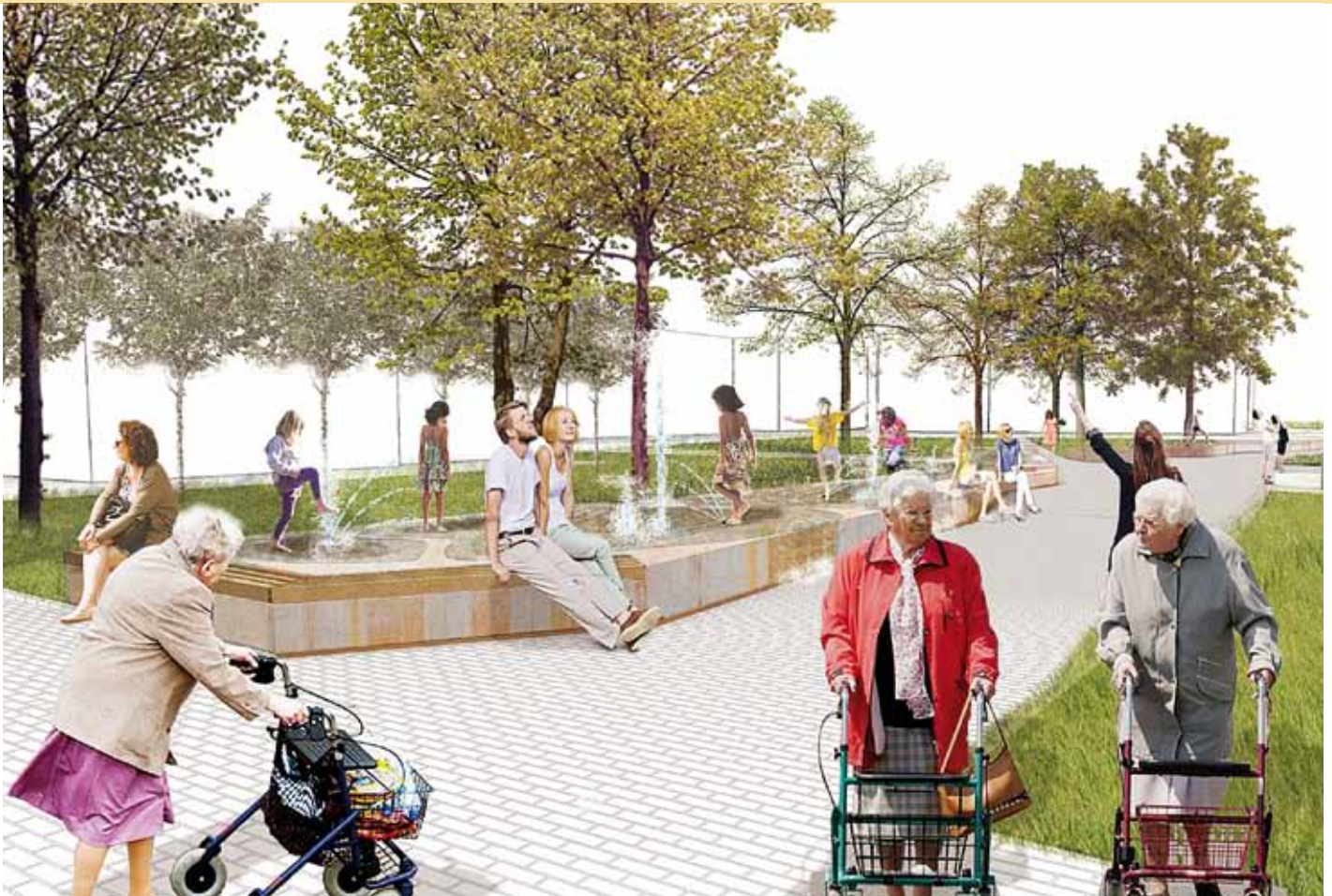
Impressie waterelement dat refereert aan de peelrandbreuk

uitstraling te geven kan het plein uitgroeien tot een fijne plek voor jong en oud waar ook terrassen meer ruimte krijgen.